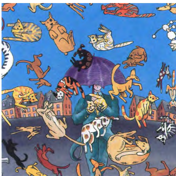
It's raining cats and dogs

Exact ! Il ne pleut pas des chats et des chiens ; il pleut des cordes !!!